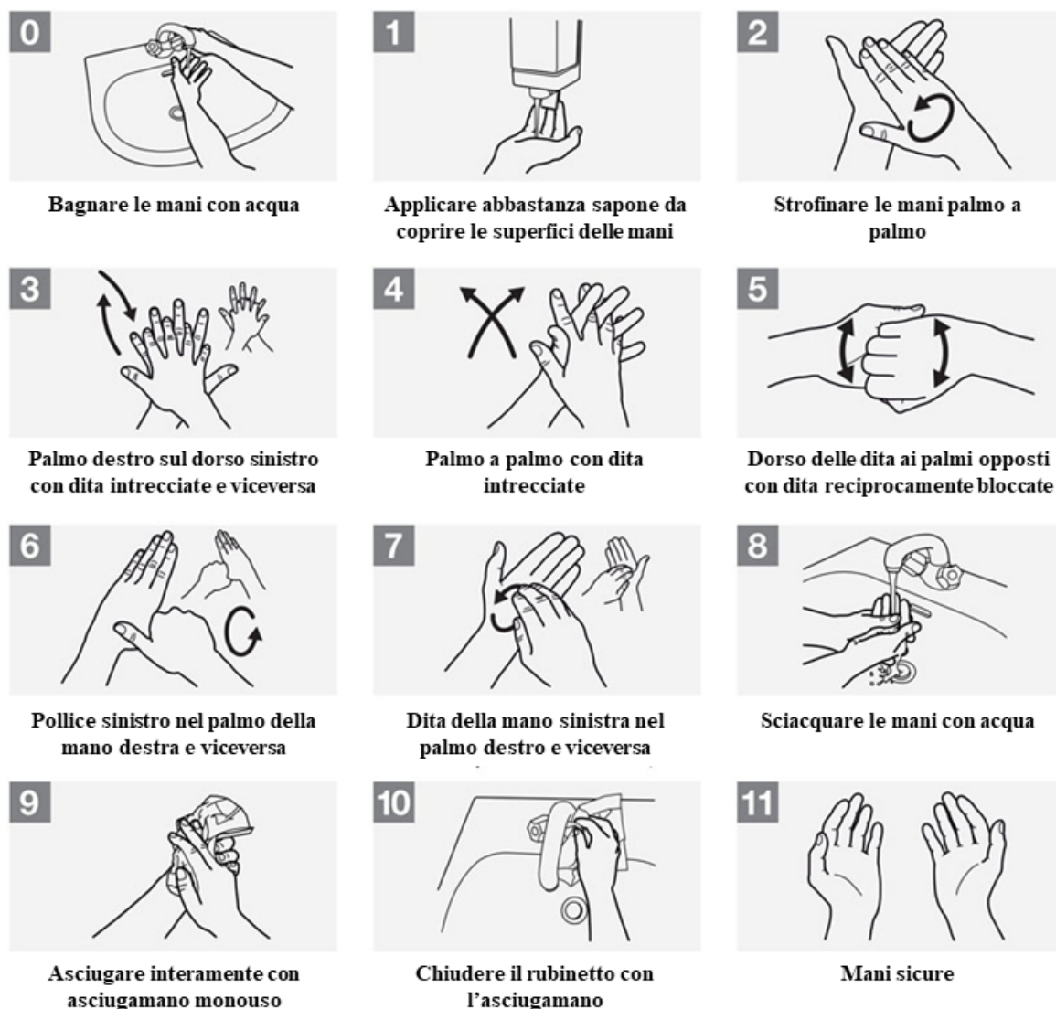
Figura 1. Procedura per il corretto lavaggio delle mani. Modificato da “WHO guidelines on hand hygiene in health care provide health-care workers (HCWs)”.